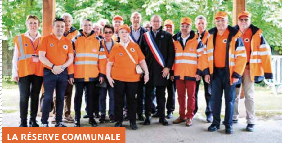
LA RÉSERVE COMMUNALE