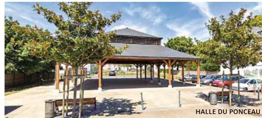
HALLE DU PONCEAU

Codsall-Bilbrook (Royaume-Uni) depuis 1998