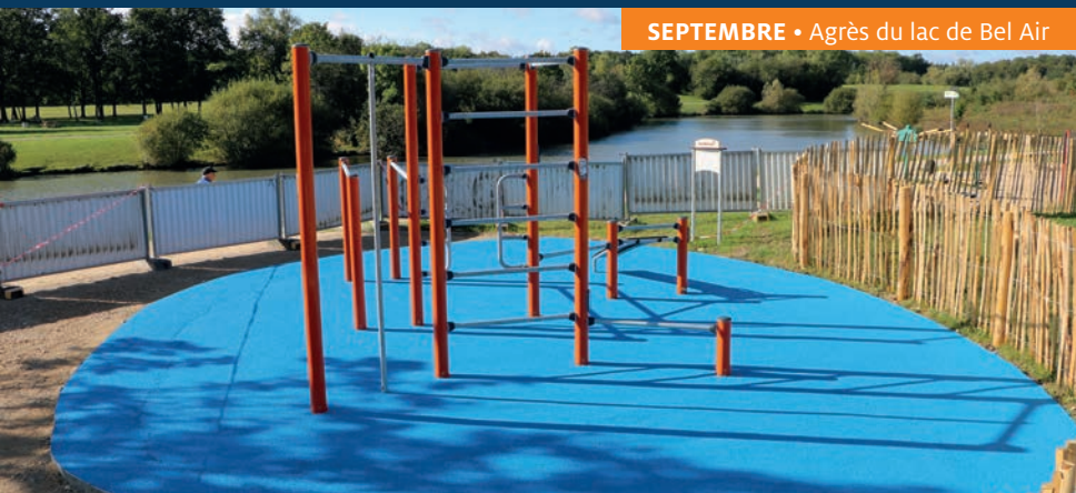
SEPTEMBRE • Agrès du lac de Bel Air