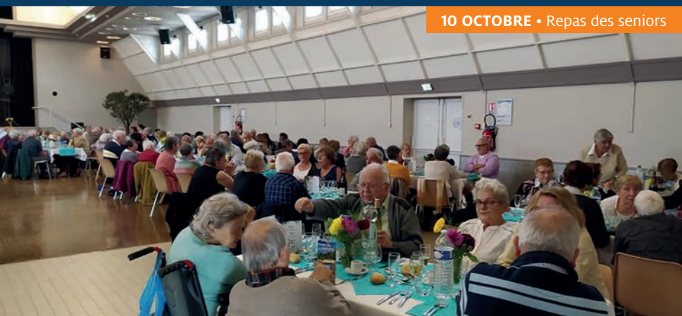
10 OCTOBRE • Repas des seniors