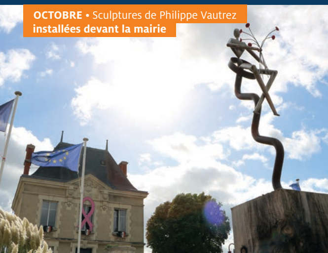
OCTOBRE • Sculptures de Philippe Vautrez installées devant la mairie