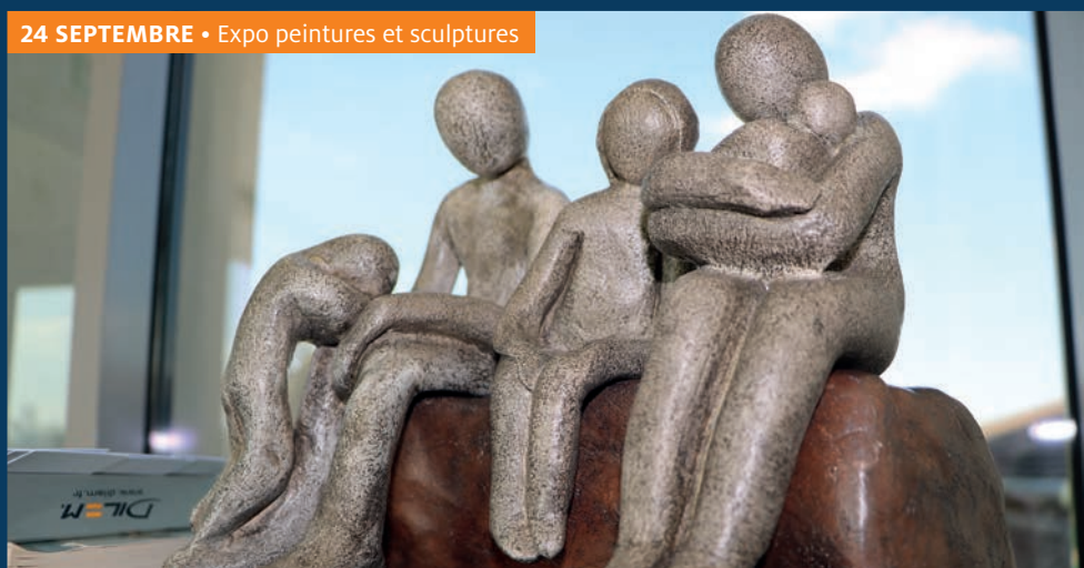
24 SEPTEMBRE • Expo peintures et sculptures