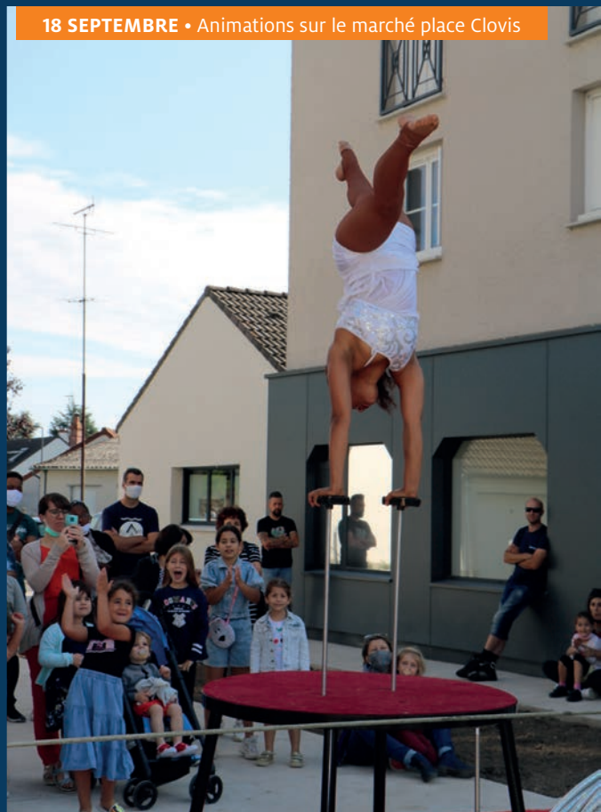
18 SEPTEMBRE • Animations sur le marché place Clovis