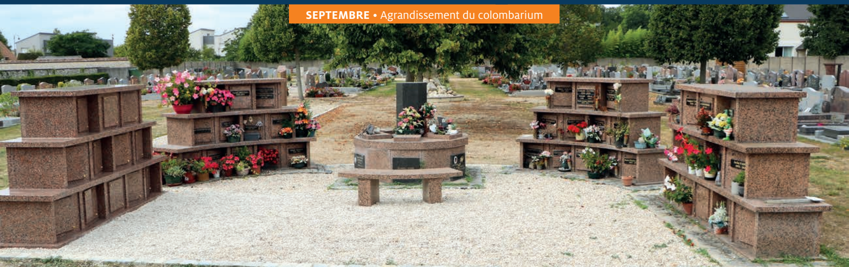
SEPTEMBRE • Agrandissement du colombarium