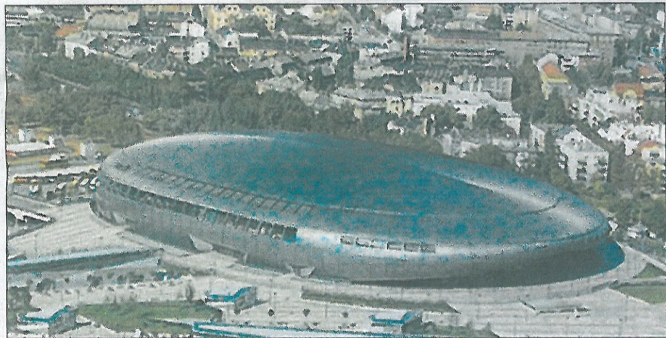
Le cabinet d'architectes « Sport concepts » a réalisé, entre autres, le national indoor Arena de Budapest en Hongrie qui accueille, depuis 2008, 1.300 spectateurs.

Le constructeur est Bouygues, le financeur, la Caisse d'Épargne Loire-Centre.