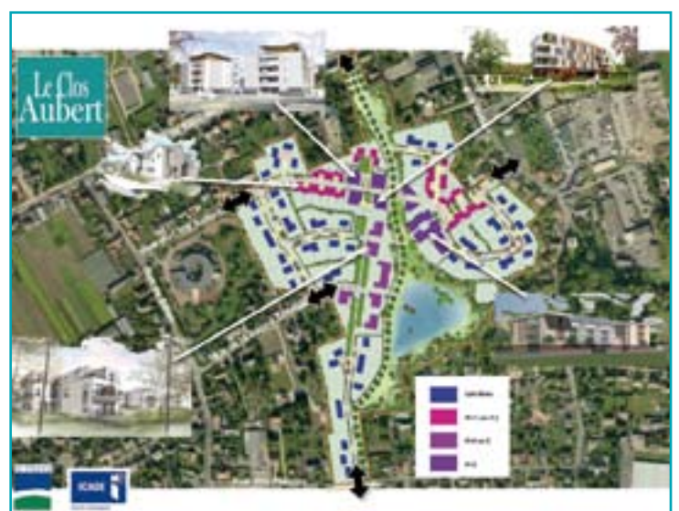
Les projets «Coeur de Ville» et «Clos Aubert»