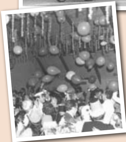
Photos : Acrobaties de la Police de Paris et réveillon de la Saint-Sylvestre à la Salle des Fêtes